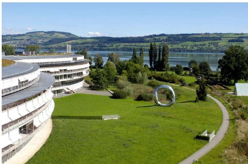
Abbildung 1: Sicht auf Paraplegiker-Zentrum und Sempachersee

Ich wage nun den Schritt und betrete als Besucher das Neuland «Schweizer Paraplegiker-Zentrum Nottwil».