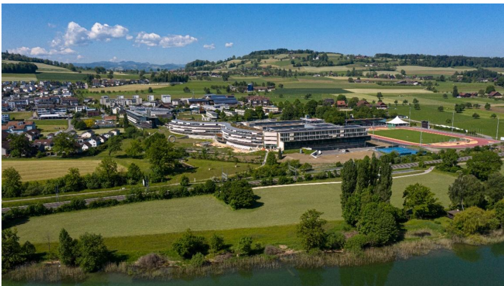
Abbildung 20: Schweizer Paraplegiker-Zentrum Nottwil