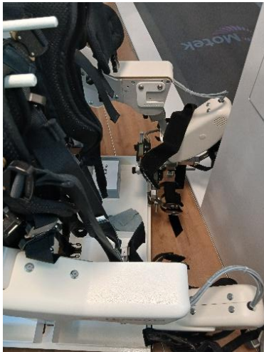
Abbildung 17: Viele Schnallen und Bänder beim Lokomat