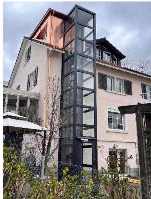
Abbildung 12: Der neue Aussenlift

Trotz allem war es für mich von Beginn weg klar, alles daran zu setzen, dass das Haus umgebaut werden soll, damit ich mich mit dem Rollstuhl darin bewegen kann. Spezialisten vom SPZ waren bei dieser Abklärung dabei. Am Schluss stand fest, dass der Bau eines Aussenliftes möglich ist. So kann ich jedes Stockwerk im Haus erreichen.