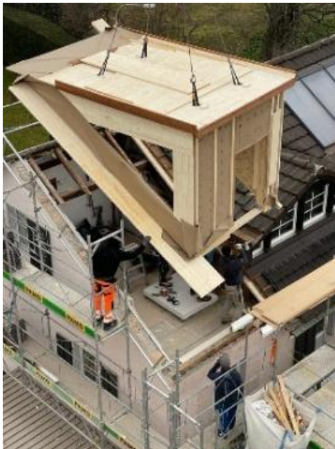
Abbildung 8: Montage der Lukarne beim Haus der Familie Fässler

Das Zentrum für hindernisfreies Bauen in Muhen (Kanton Aargau) bietet für querschnittgelähmte Menschen und ganz allgemein für Menschen mit Behinderungen Bauberatung an. Dieses Zentrum stellt eine wichtige Anlaufstelle für viele verschiedene Bedürfnisse im Baubereich dar.