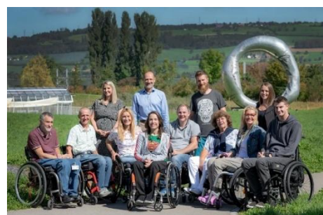
Abbildung 7: Team Peer-Beratung

Das englische Wort «Peer» bedeutet «der Ebenbürtige, der Gleichgestellte». Sogenannte Peerberater und Peerberaterinnen des SPZ sind Betroffene, die sich seit mehreren Jahren mit all den Problemen von Querschnittgelähmten auskennen. Sie haben alles selbst erlebt und geben ihr Wissen nun an Betroffene weiter. Es ist eine Beratung von Betroffenen für Betroffene. Sie kennen sich in Themen wie Mobilität, Selbstständigkeit,