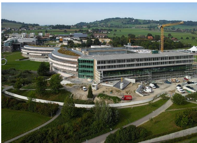
Abbildung 5: Erneuerung und Erweiterung des SPZ

Guido A. Zäch ist ehemaliger Chefarzt des Paraplegiker-Zentrums Basel. 1975 gründete er die Schweizer Paraplegiker-Stiftung (SPS). Obwohl es zuerst nicht ganz einfach war, einen geeigneten Ort für ein neues Zentrum zu finden bzw. nicht auf Widerstand der Bevölkerung zu