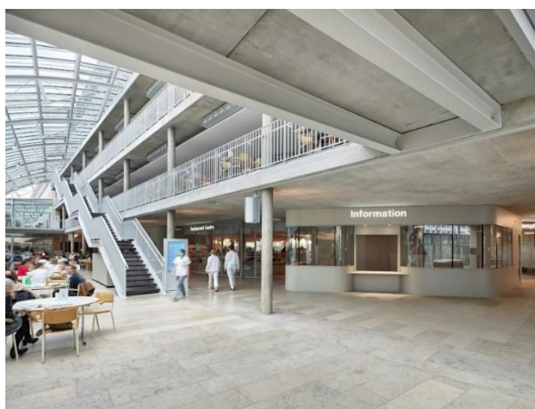
Abbildung 3: Empfangshalle

Das SPZ ist eine Spezialklinik im Bereich Querschnitt-, Rücken- und Beatmungsmedizin. Es handelt sich also um ein Reha-Zentrum für querschnittgelähmte Menschen. Ziel ist es, betroffene Personen in den Alltag zu integrieren, so dass sie am gesellschaftlichen und beruflichen Leben wieder teilnehmen können. Dazu stehen dem SPZ eine grosse Anzahl von Behandlungs- und Therapiemöglichkeiten zur Verfügung. Insgesamt gibt es 204 Betten, welche für die Akutbehandlung und Rehabilitation von querschnittgelähmten Patienten und Patientinnen bereitgestellt werden.